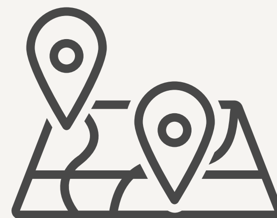
Carto des acteurs