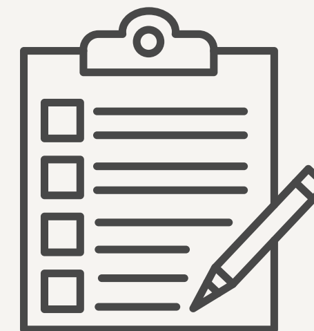
Prochains "petits pas"