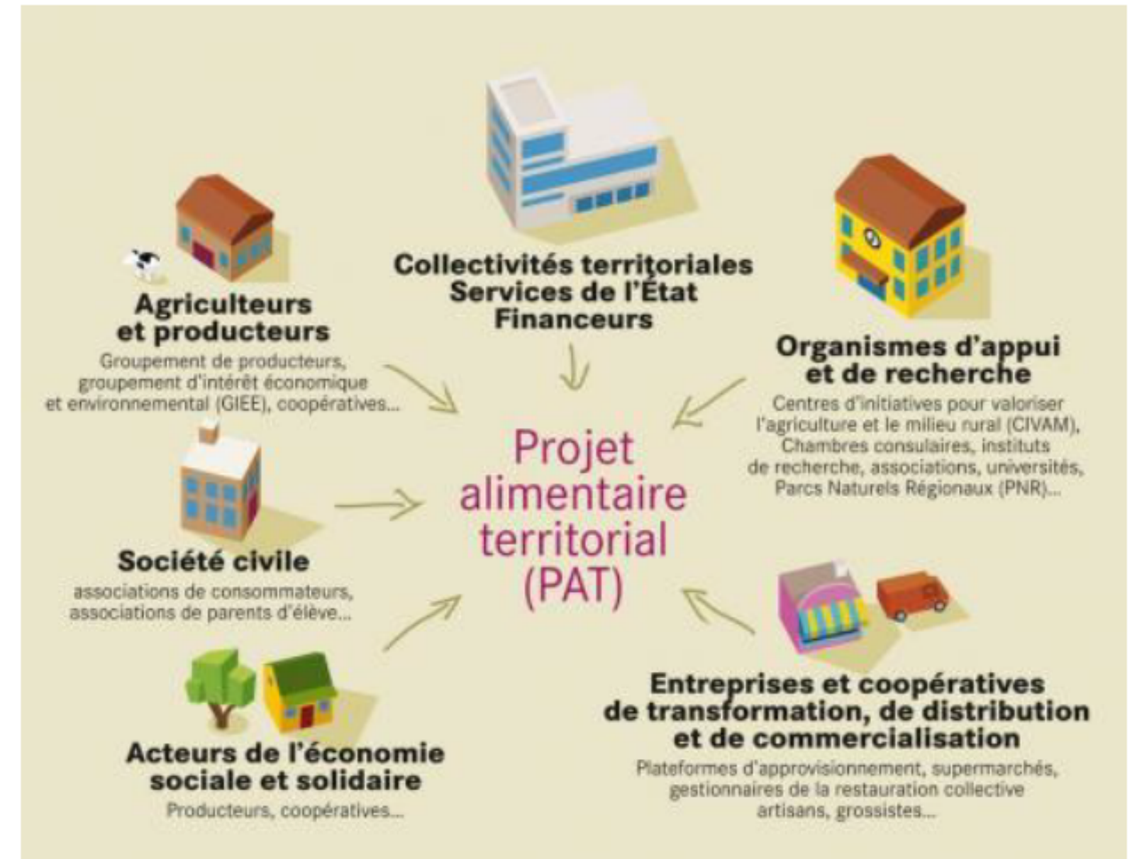
Les différents acteurs de l'agriculture et l'alimentation